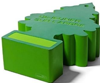
Dejeuner sur l'Arbre, Centre Pompidou