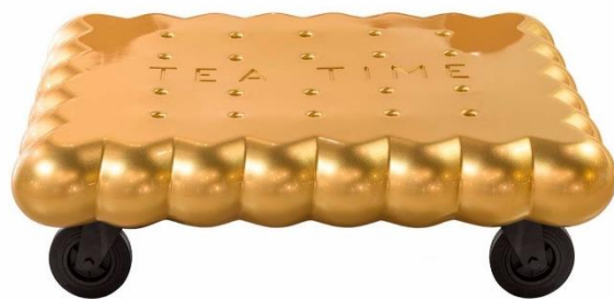
Tea Time(Slide) ADAM Museum