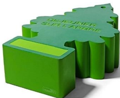
Dejeuner sur l'Arbre, Centre Pompidou

Per l'influenza svolta con la sua opera nel campo dell'architettura e del design con la Mostra "BigBang" del Centre Pompidou, la figura di Gianni Arnaudo è stata collocata fra le personalità che hanno caratterizzato le svolte più significative in campo artistico nel XX secolo.